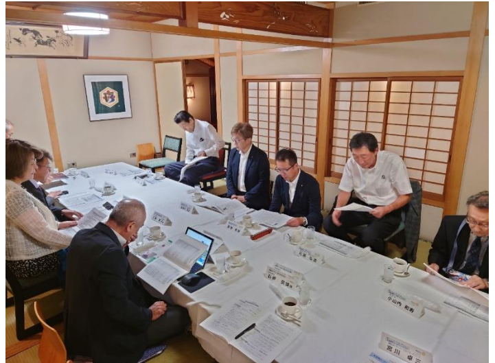
▲クラブ協議会（弘前西ロータリークラブ）