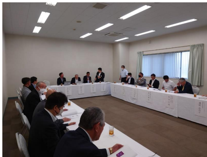
▲クラブ協議会（十和田八甲ロータリークラブ）