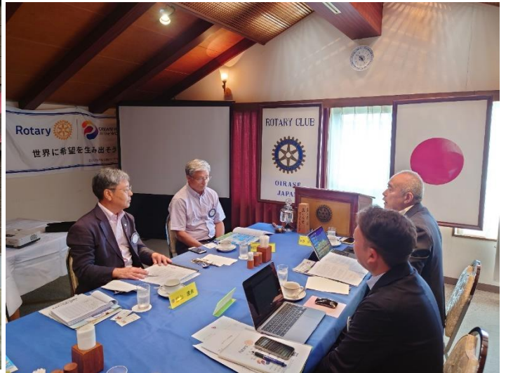
▲会長・幹事面談（おいらせロータリークラブ）