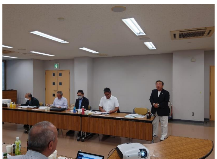
▲今会長挨拶（平賀・尾上ロータリークラブ）